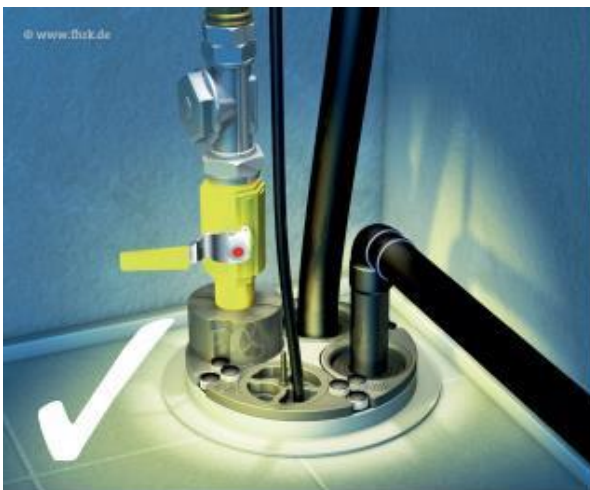
Abbildung 2: Beispiel Mehrspartenhauseinführung (theoretisch)

Der Einbau eines nach DIN 18322 und DVGW-VP 601 zugelassenen Hauseinführungssystems ist Zwingend erforderlich.