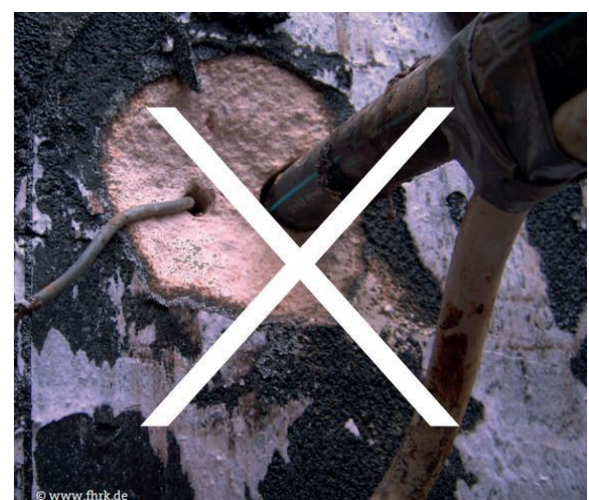
Abbildung 4: Nicht fachgerechte Abdichtung