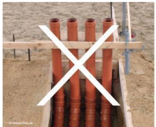
Abbildung 4: Nicht fachgerechte Abdichtung