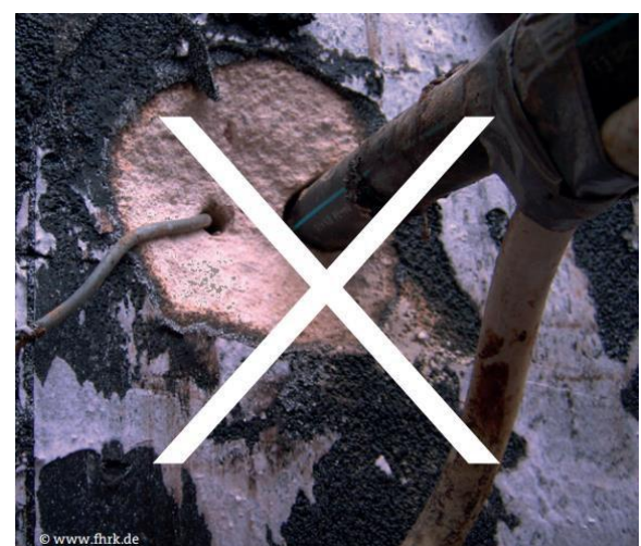
Abbildung 4: Nicht fachgerechte Abdichtung