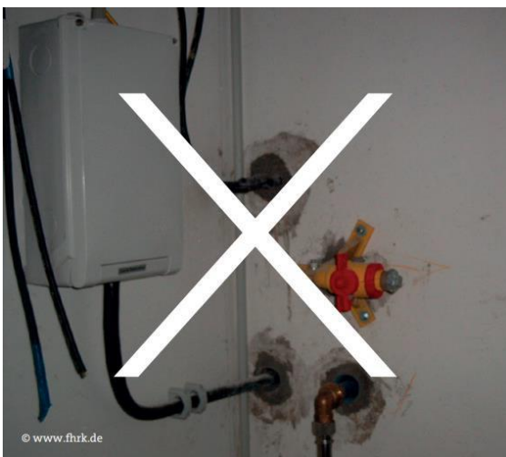
Abbildung 3: Nicht gas- und wasserdichte Ausführung

verwenden Sie auf keinen Fall unzulässige Mantelrohre „z.B. KG-Rohr“ (DIN 18322, DVGW-VP 601).