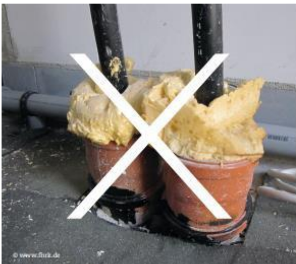
Abbildung 3: Nicht gas- und wasserdichte Ausführung

verwenden Sie auf keinen Fall unzulässige Mantelrohre „z.B. KG-Rohr“ (DIN 18322, DVGW-VP 601).