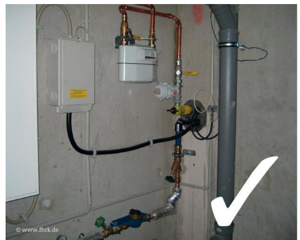
Abbildung 2: Praxisbeispiel Mehrspartenhauseinführung