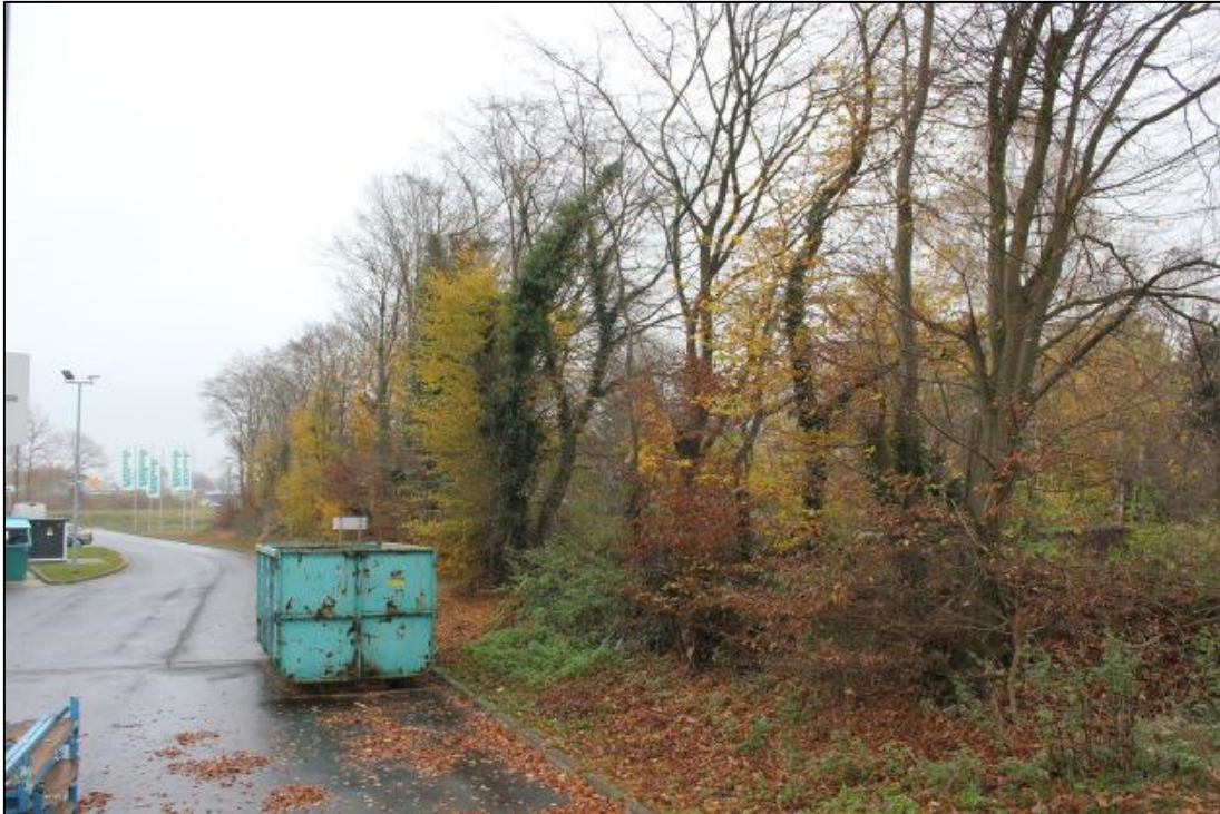
Saumstruktur angrenzend zur Gewerbefläche Teppich Kibek.