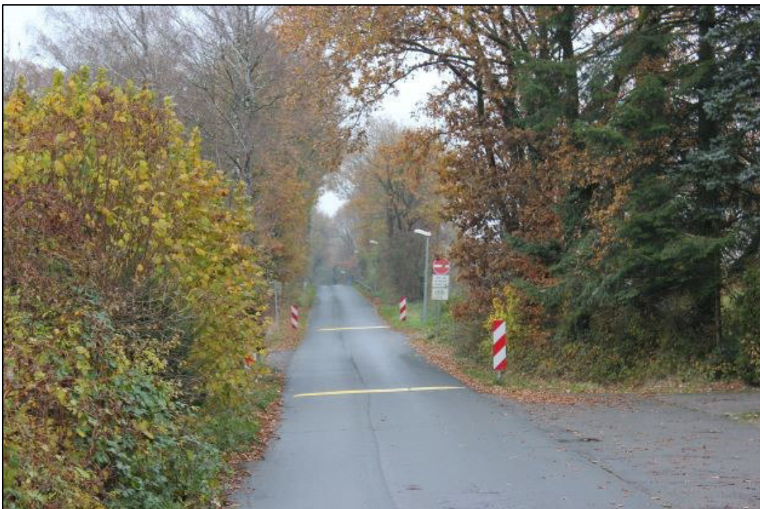
Saumstruktur an der Sunderstraße.