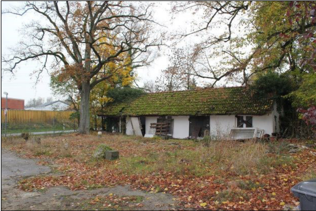
Gebäude der ehemaligen Gärtnerei (Hauptstraße).