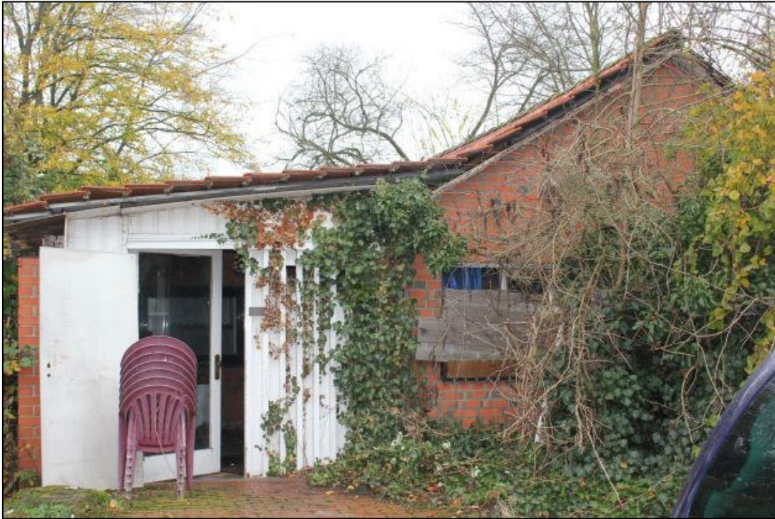
Gärtneergebäude (angrenzend zur Gewerbefläche Teppich Kibek) - Giebelseite Süd -.