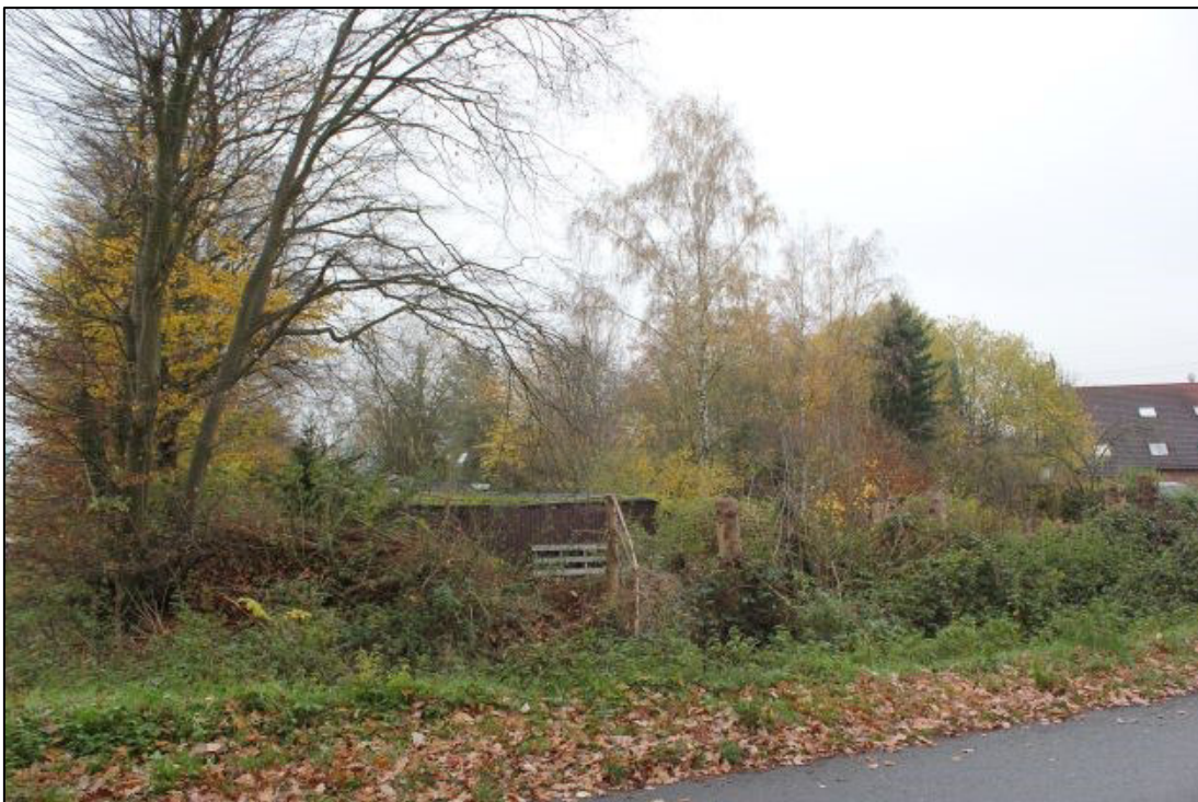
Planungsraum: Sunderstraße (Blickrichtung südost).