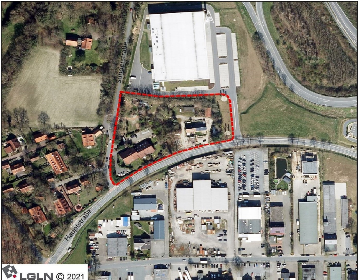
Abb. 2: Untersuchungsraum (ohne Maßstab).

bildet zum Teil die Gemeindegrenze zu Osnabrück. Das Fließgewässer ist naturnah ausgebaut und überwiegend von Gehölzstrukturen bzw. Grünland und Ackerflächen gesäumt.