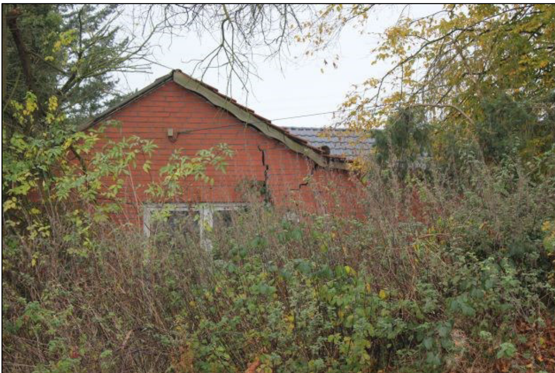
Gärtneergebäude (angrenzend zur Gewerbefläche Teppich Kibek) - Giebelseite Nord -.