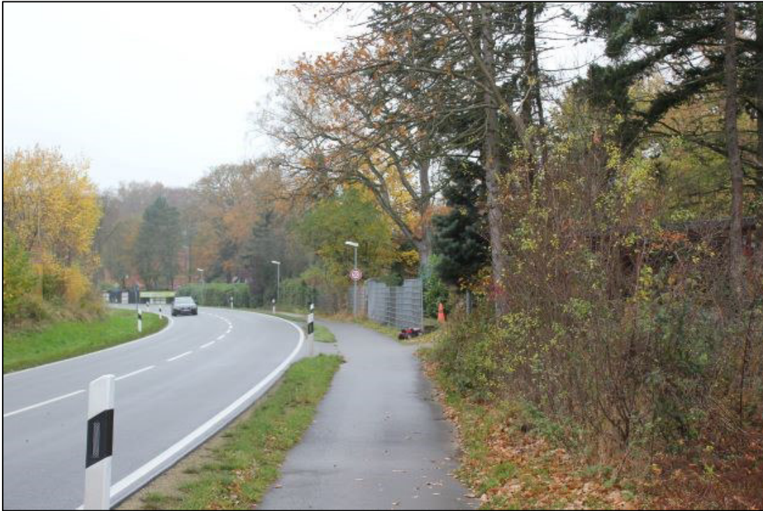
Saumstruktur an der Hauptstraße.