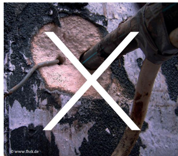
Abbildung 4: Nicht fachgerechte Abdichtung