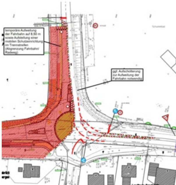
Sperrung Knotenpunkt Freibad

Im Anschluss an die erste Hälfte des Kreisverkehrsplatzes ist dann eine Vollsperrung der Ortsdurchfahrt Hasbergen notwendig. Hier wird die Tecklenburger Straße abschnittsweise bis vor die Kreuzung mit der Schulstraße gesperrt und erneuert. Ab diesem Zeitpunkt ist die Strecke von Hasbergen nach Gaste nur noch über eine ausgewiesene Umleitungsstrecke möglich. Über diese Änderung der Sperrungen wird der Landkreis zum entsprechenden Zeitpunkt ausführlich informieren.